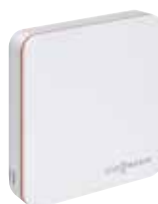
Termostato ViCare para más comodidad y eficiencia